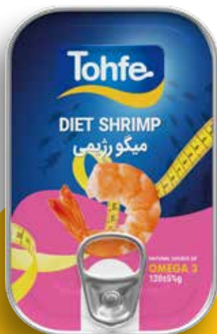
کنسرو میگو رژیمی (در آب نمک)