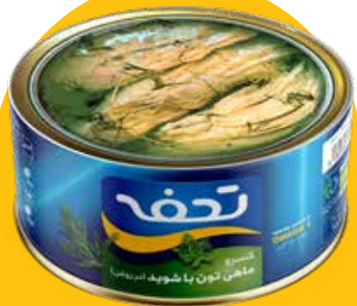
کنسرو ماهی تون با شوید (در روغن)