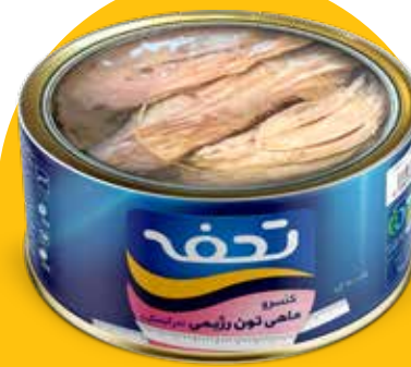
کنسرو ماهی تون رژیمی (در آبنمک)