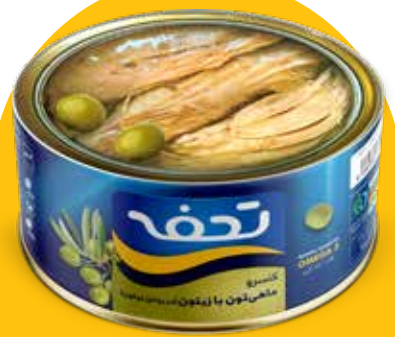
کنسرو ماهی تون با زیتون (در روغن زیتون)