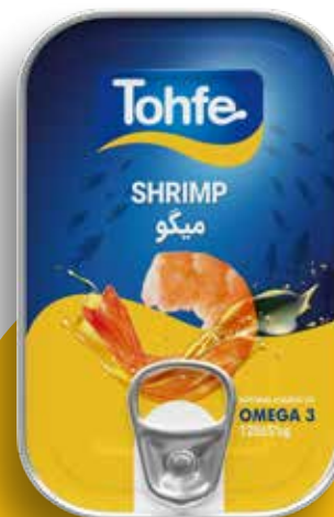
کنسرو میگو (در روغن)