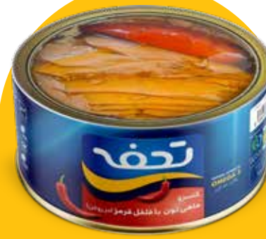
کنسرو ماهی تون با فلفل قرمز (در روغن)