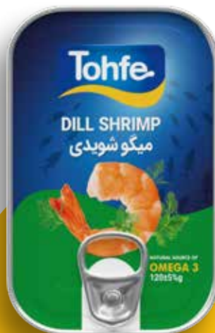
کنسرو میگو شویدی (در روغن)